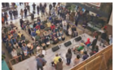
様々なイベントが開催できます