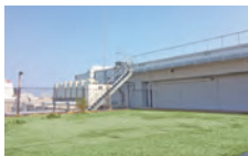
屋上でランチもおススメです