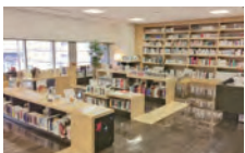
ライブラリーにはアートに関する書籍・漫画などがそろっています