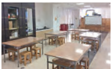
絵本や木の玩具を備えたキッズルーム、ご飲食も可能な交流サロン