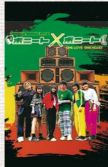
ポニートXポニート (From 日南)