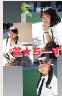
盆☆チーズ (From 都城)