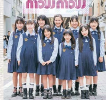
mow mow (From 宮崎)