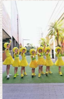
ゆずっこガールズ (From 西米良)