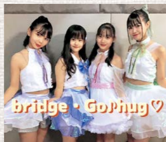
Bridge・Go♪hug♡ (From 福岡)