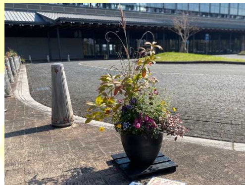
昨年度の日向市長賞

表彰式 令和5年11月21日（火）10：30～ ◎会場：あくがれ広場（日向市駅前交流広場） ◎入賞作品には賞状、副賞を贈呈します