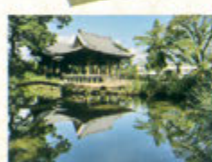
五百禰神社 (いおしんじゅ)