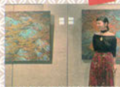
張祐勳(台湾人芸術家)