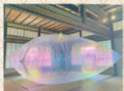
アーティスト 中村 慎仁 (インスタレーション)