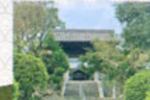
願成就寺 (がんじょうじゅじ)