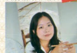
胡晴雯(台湾人芸術家)