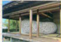
花道家 永友美奈子 (インスタレーション)