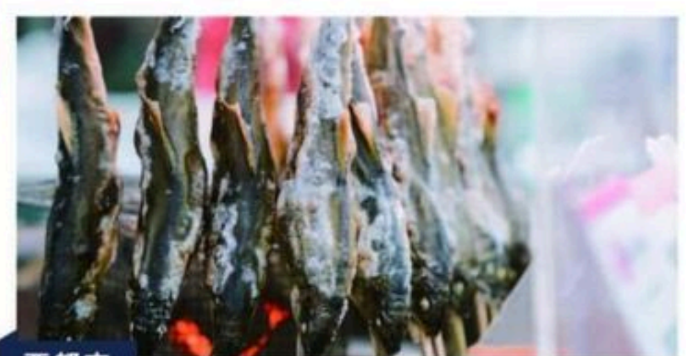
西都市 鮎のよしの