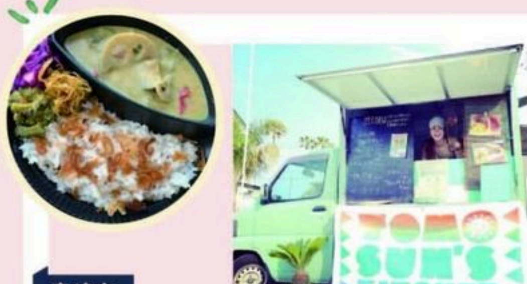
宮崎市 tom*sun'skitchen 鶴翅