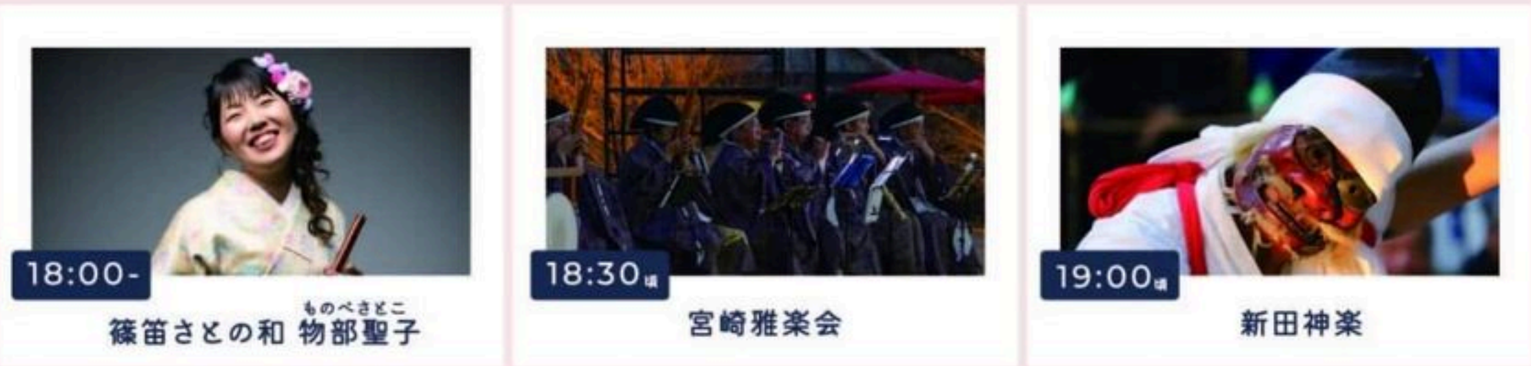
18:00- ものべさどこ 篠笛さとの和 物部聖子