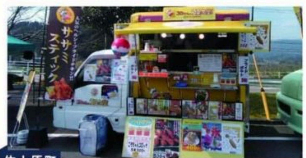
佐土原町 コロちゃんのコロッケ屋