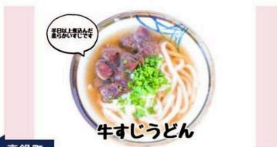
高鍋町 牛すじうどん DON DON