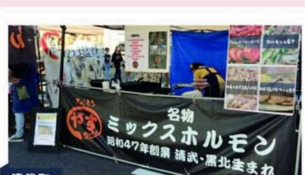
清武町 ホルモンのやすちゃん