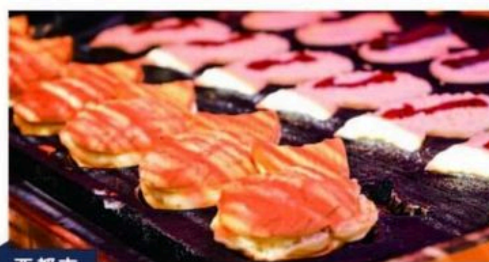
西都市 たい焼きとよちゃん