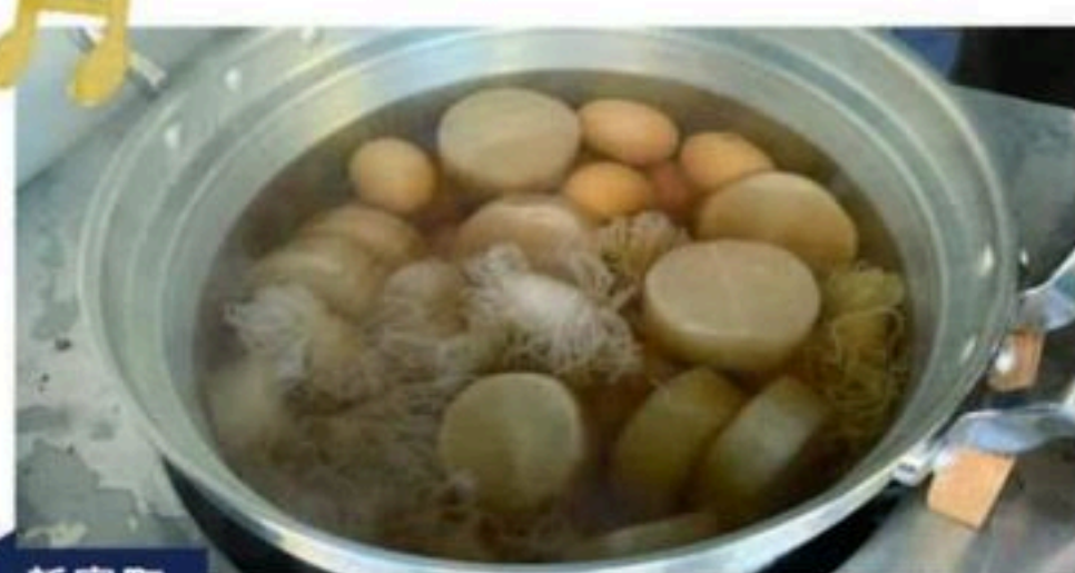
新富町 おでんまる