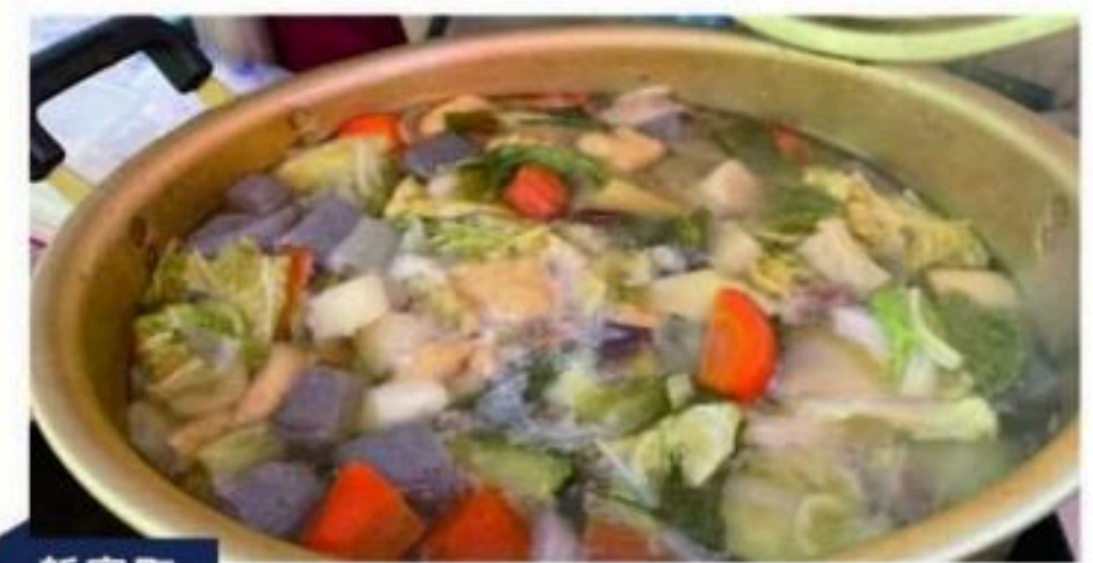
新富町 空の駅 竜馬