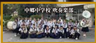
中郷中学校 吹奏楽部