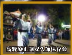
高野原正調安久節保存会