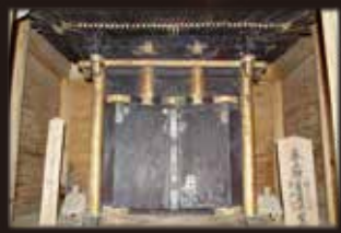
興玉神社内陣神殿(御帳台)

内神殿(厨子)が昭和58年6月、国の重要文化財に指定。 応永6年(1399年)の製作で現在南九州最古の建造物とされている。