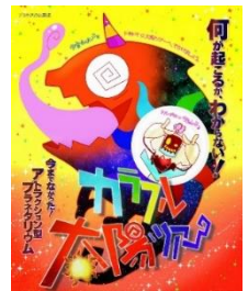
カラフル太陽ツアー