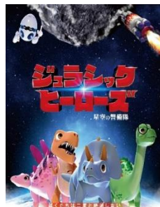
ジュラシックヒーローズ