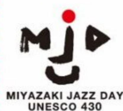
MIYAZAKI JAZZ DAY UNESCO 430