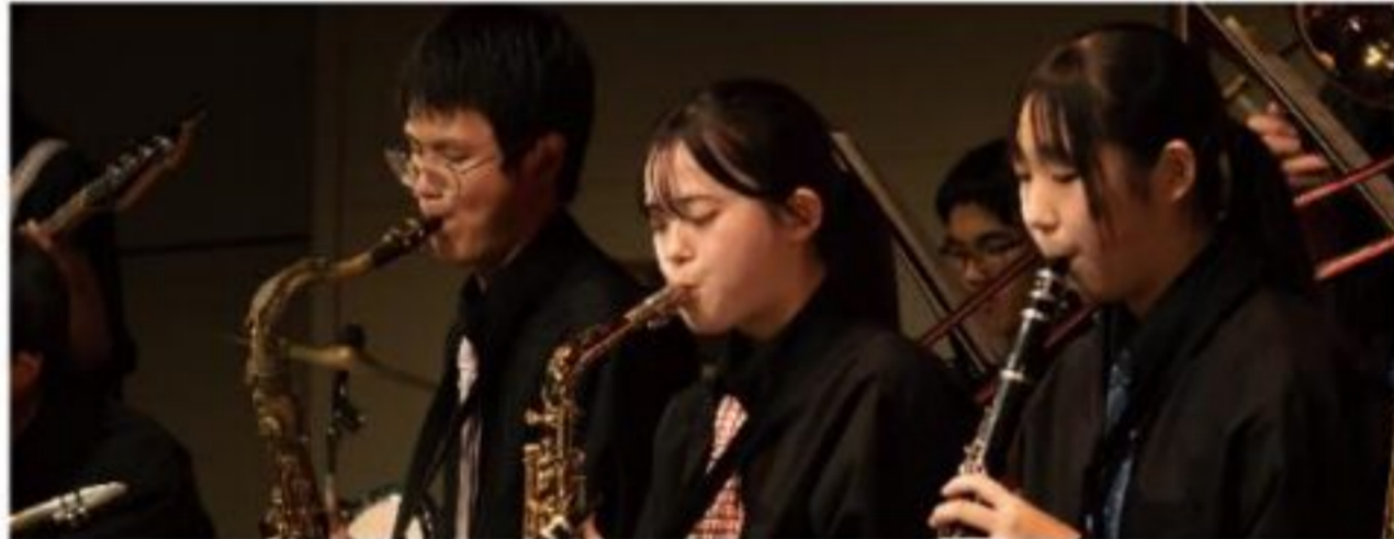
都城工業高校「TOKO Big Band」