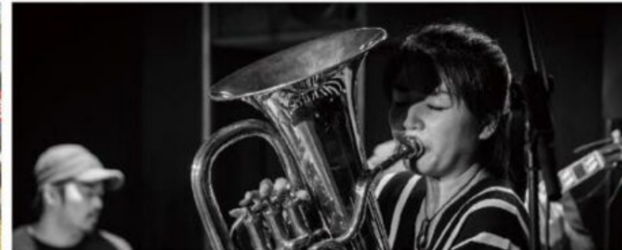
一般社団法人 宮崎県ジャズ協会