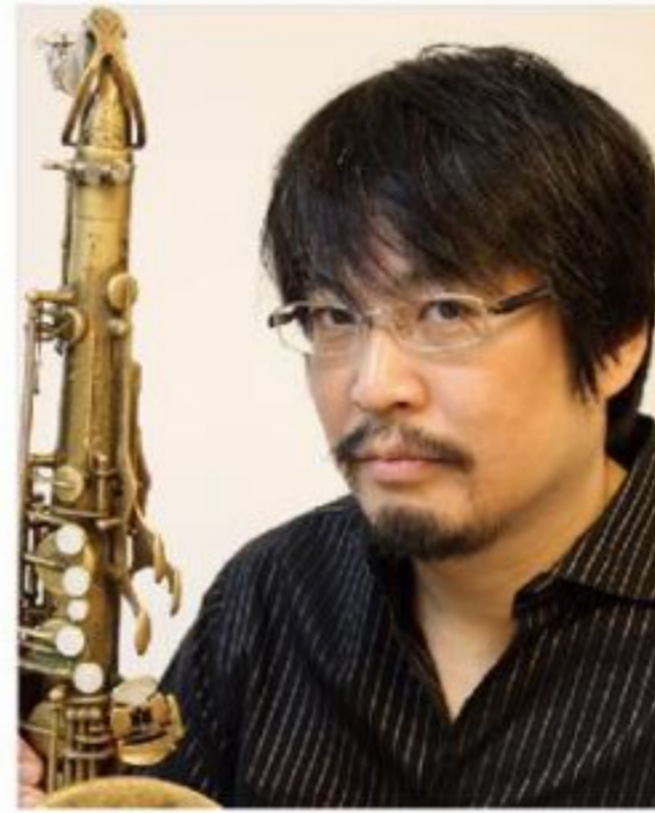
tenor sax 川嶋 哲郎 Tetsuro Kawashima