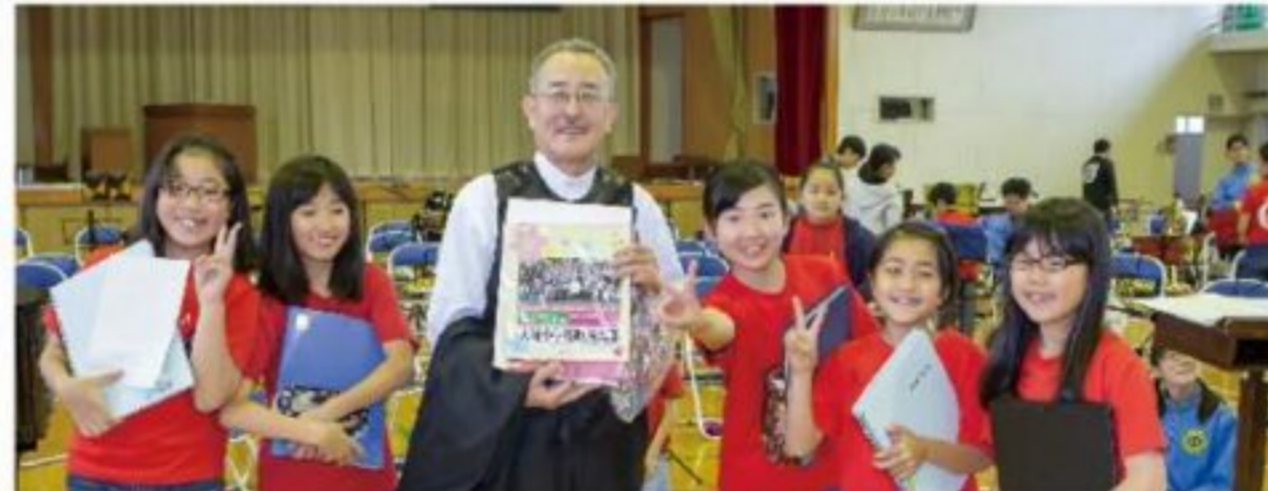
「大淀小中学校吹奏楽部のOB」