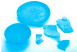
畿内産土師器(日向国府跡ほか) 西都市教育委員会・宮崎県埋蔵文化財センター蔵

古墳時代に引き続いて、古代においても政治・経済の中心が西都原台地周辺だったのです。