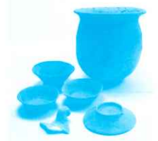
煮炊具と食器(丸山遺跡) 当館蔵

当時の人々の暮らしぶりが読み取れる遺物や遺構を通じて、モノやヒトの移動や交流のあり方を探ります。