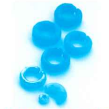
金環と玉類(酒元ノ上横穴墓群) 当館蔵

この頃、小さな円墳や横穴墓などが古墳群内で密集して築造されます。群集墳化という新たな動きです。こうした古墳群の変容は、次の時代への序章といえます。