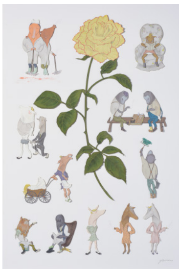
1. 蒼山日菜《ウィンターフェアリー》(2015) 2. 福井利佐《Formative experience》(2018) 3. 松原真紀《team BLUE》(2019) 4. SouMa《枝垂れ玉花》(2021) 5. 柳沢京子《キュー、して、「母子像」より》(2021) 6. 切り剣 Masayo《海蛸子》(2018) 7. 筑紫ゆうな《無題》(2019)