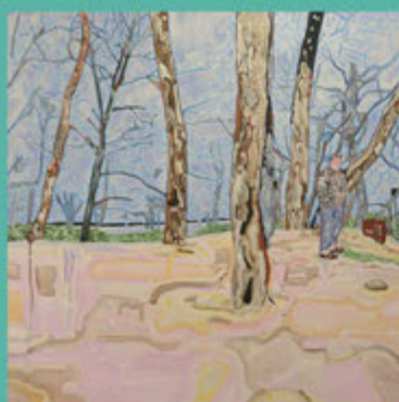
the branches are melting the sky (2021) アクリル絵具、油絵具