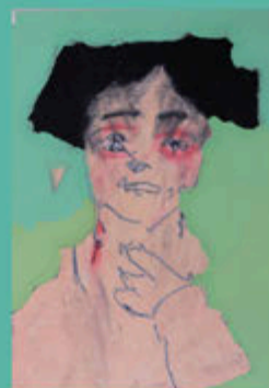
ゆうたろうさん (2021) ペン、クレパス、アクリル絵具