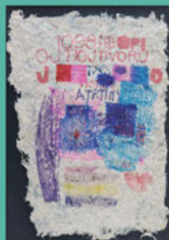
地図を多くのように (2020) ペン