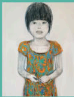
アトリエに美た子 (2023) アクリル、色鉛筆