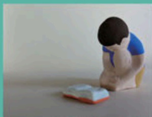
本の虫 (2019) 粘土、アクリル絵具