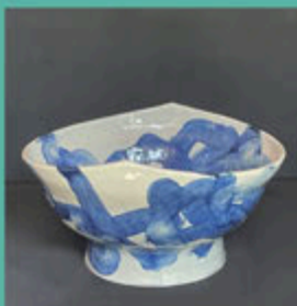
鉢 (2016) 陶器