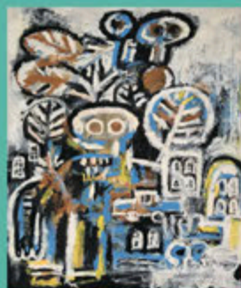
無題 (2022) アクリル絵具