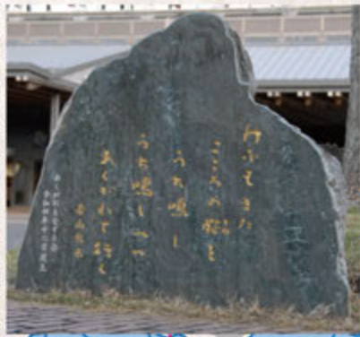
(日向市 日向市駅前あぐれ広場)