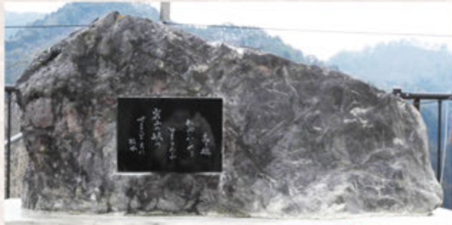
(群馬県 猿ヶ京関所跡)