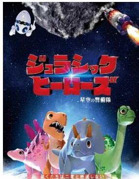
ジュラシックヒーローズ