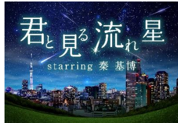
君と見る流れ星 starring 秦基博