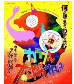
カラフル太陽ツアー