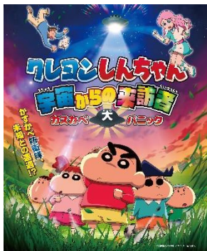
クレヨンしんちゃん