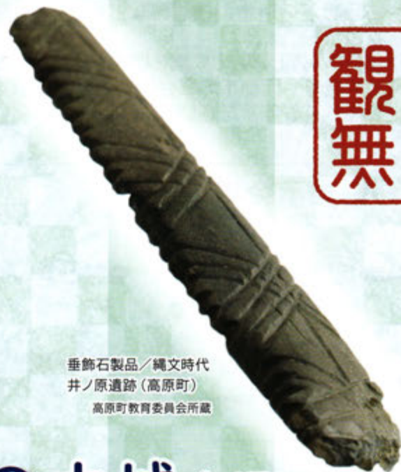
垂飾石製品/縄文時代 井ノ原遺跡(高原町) 高原町教育委員会所蔵