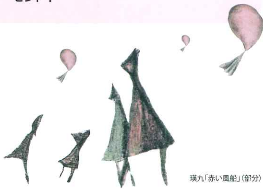
琉九「赤い風船」(部分)