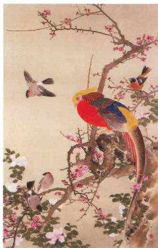
川端玉章「梅錦鶏鳥図」