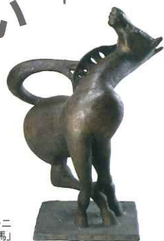
ペリクレ・ファツツイーニ 「あばれる馬」