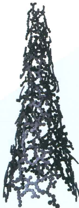
青木野枝「ふりそそくもの-9」