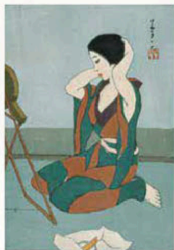
《化粧する女(港屋版)》1914(大正3)年

夢二作品展覧会(京都府立図書館)を開催する。1914(大正3)年、港屋絵草紙店(日本橋)を開店する。1923(大正12)年、恩地孝四郎らと「どんたく図象社」結成発足の宣言文を発表。渋谷にある家で関東大震災に遭遇する。1931(昭和6)年、渡米する。1932(昭和7)年、個展(ロサンゼルス・サンベドロ)を開催後、ハンブルクに到着。欧州各地を巡る。1933(昭和8)年、帰国し、病に臥す。1934(昭和9)年、富士見高原療養所(長野県)に入院し、結核のため逝去。