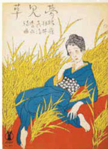
《セノオ楽譜 No.237「夢見草」 1916~(大正5~昭和初期)年

着物または浴衣でご来館の方は当日料金から200円割引 ※小中高生・高齢者・障がい者は100円割引