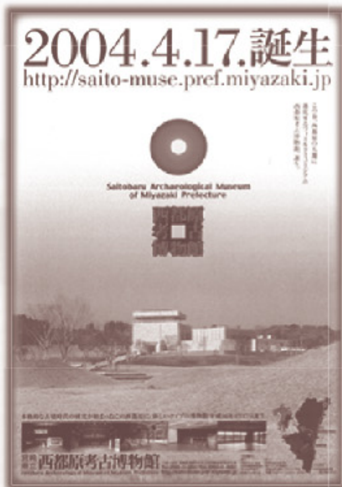
2004(平成16年) 「開館告知」ポスター

西都原考古博物館は、令和6年4月に開館20周年を迎える。 これを記念したイベントとして、これまでに行われた展示会の ポスターを通して、西都原古墳群とともに歩んだ博物館の歴史を 振り返る。