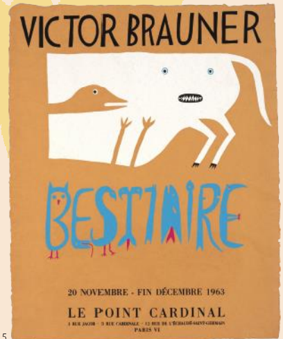
1. ジュール・シェレ《マリアーニ・ワイン》(1894) 2. アドルフ・カッサンドル《北方急行》(1927) © www.cassandre.fr APPROVAL by the ESTATE OF A.M. CASSANDRE / JASPAR 2024 E5676 3. マン・レイ《ロサンゼルス・カウンティ美術館での展覧会》(1966) © MAN RAY 2015 TRUST / ADAGP, Paris & JASPAR, Tokyo, 2024 E5676 4. アルフォンス・ミュシャ《第20回サロン・デ・サン(白選展)》(1896) 5. ヴィクトル・ブローネル《動物寓話》展、ル・ボアン・カルディナル画廊》(1963)

古代ローマ時代から存在したといわれるポスターは、時代を経て印刷技術の進歩とともに急速な発展を遂げていきました。広告媒体であるポスターに、新たな表現の可能性を見いだした芸術家たちは、互いに競い合うように、観る人の印象に残る想像力に満ちた作品を創り出しました。19世紀後半のパリでは、シェレやロートレック、ミュシャらが人気ポスター画家として活躍しました。パリの外壁は様々なポスターで彩られ、自由で新しい表現は興隆を極めました。それは、ポスターが単なる商業用告知物にとどまらず、新たな芸術様式となる幕開けでもありました。20世紀になると、ピカソ、マティス、シャガール、ミロなどの巨匠たちが、自身の個展の宣伝やイベントの告知のためにオリジナルのポスターを制作しました。本展では、ポスター芸術の確立とその後の展開を、約160点の作品でたどります。色鮮やかで心躍るポスターたちの競演をお楽しみください。