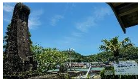
日本海軍発祥之地碑