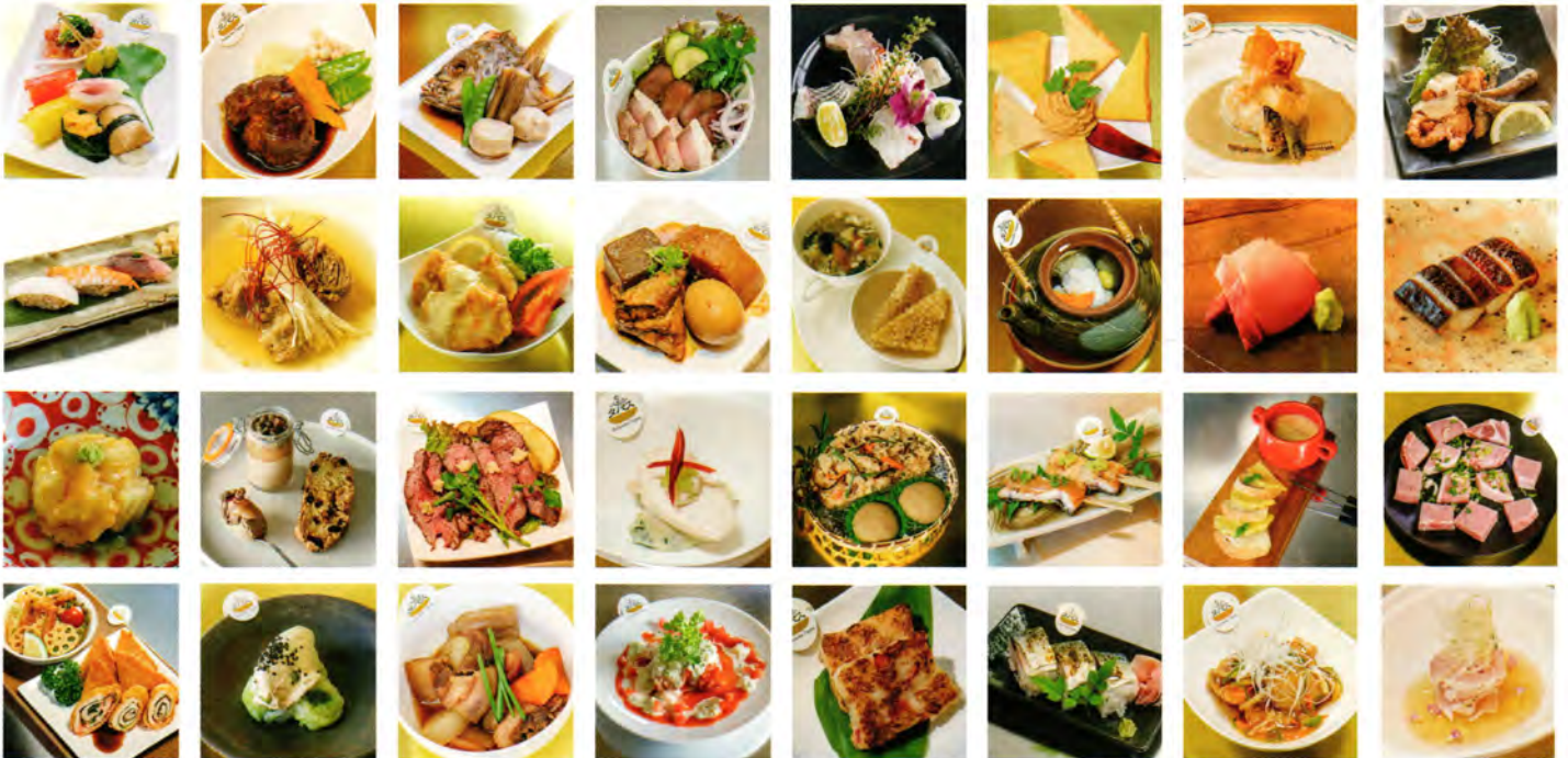
※写真はイメージです。(過去に提供されていたタパスメニューです。)